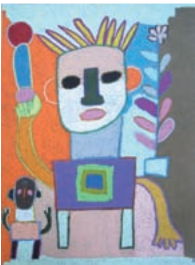
●「花を買った自由の女神」XL(スウィング/京都府)