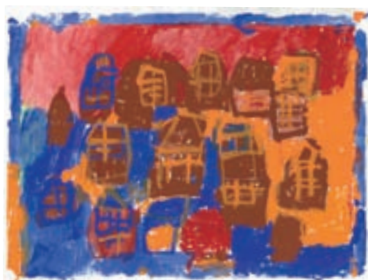
●「箱庭の家」 大島憲和(風の丘/三重県)